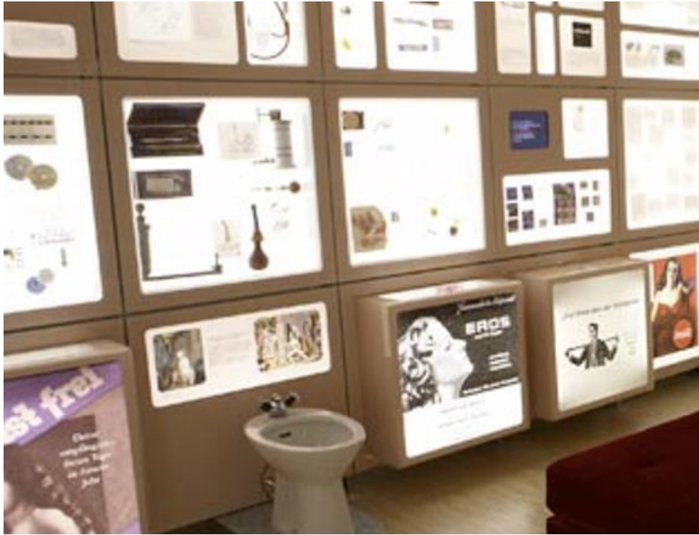
(c) Museum für Verhütung und Schwangerschaftsabbruch