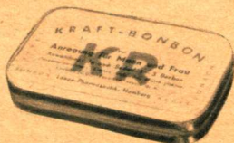
KR-Bonbon Normal-Packung mit 30 Stück DM 5,20