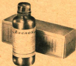
Erosex 25 ccm (flüssig) DM 6,50