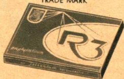
Rimbacher R 3 mit Trisenium 24 Stück DM 8,—

Trotzdem argumentieren einige Männer, daß die Anwendung des Kondoms mit Gefühlsverminderung verbunden sei. Auch wird befürchtet, daß doch einmal ein Materialfehler vorkommen könnte!