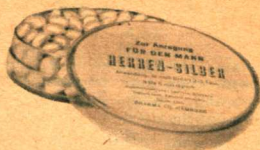
Herren-Silber Normalpackung DM 7,20

Dafür sorgen einige Mittel, die durch ihre belebende Wirkung eine Abstimmung des beiderseitigen Sexualgefühls ermöglichen.