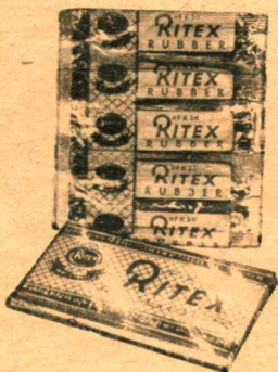
„FK 3“ Ritex-Rubber 24 Stück DM 9,60

kannte man Kondome in der Art öl- und harzgetränkter Linnen-überzüge, während in späteren Zeiten Fischbläschen verwandt wurden, die vor Empfängnis und Infektion schützen sollten. — Nun, wer würde es auch bezweifeln, daß erst die Industrie des 19. Jahrhunderts den Gummi-Kondom schuf, wie er heute mit Recht selbst von Ärzten als einwandfreier Schutz empfohlen wird.