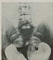
Abb. 6. Der Uterus ist hier nach Schauta-Wertheim interponiert, die rechte Tube in ganzer Länge dargestellt, die laterale Hälfte derselben ist verdickt und auch in der Restaufnahme nach 24 Stunden noch voll gefüllt. Auch in die linke Ampulle scheint nach dieser Zeit noch ein Rest von dem Kontrastmittel vorgedrungen zu sein. Die Bauchhöhle ist frei von Jodipin.

mag. Nach 24 Stunden ist der Uterus noch nicht vollkommen entleert, was der große mittlere Schatten zeigt, der verhältnismäßig gut abgegrenzt ist und der wohl mit Sicherheit von einer schwadigen Verteilung in der Bauchhöhle zu unterscheiden ist. Der Flüssigkeitsschatten in der verschlossenen linken Ampulle ist auch deutlich. In der rechten Tube ist die erst sichtbare kurze Füllung verschwunden, dagegen erkennen wir jetzt einen kleinen bogenförmigen Schatten, der wohl sicher als die Abbildung der durch die Tubenbewegung bis in die Madlenerschlinge geförderten Kontrastflüssigkeit zu deuten ist. Im übrigen fehlt auch hier jedes Anzeichen des Austrittes von Flüssigkeit in die Bauchhöhle.