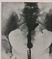
Abb. 2. Die Beobachtung unter dem Leuchtschirm ließ hier deutlich die Durchgängigkeit der rechten Tube bis zum ampullären Teil, wo sich die Flüssigkeit sammelte, wahrnehmen. Die erste Aufnahme, die etwa 10 Minuten nach der Auffüllung gemacht wurde, gibt uns das Bild einer lebhaften Kontraktionswelle des Uterus, die Kontrastflüssigkeit in der Tube ist bereits bis zur Ampulle ge-

Abb. 1 ist die Aufnahme von einer Pat., die im Anschluß an die Sectio parva sterilisiert wurde. Wir erkennen einen etwas breiten Cavumschatten, die linke Tube ist fast in ihrer ganzen Länge dargestellt, eine Schlinge ist nicht zu erkennen, dagegen sieht man gut die scharf begrenzte und verbreiterte Ampullenfüllung. Die darunter befindliche Restaufnahme nach 24 Stunden läßt einen deutlich zirkumskripten Füllungsrest in der Ampulle erkennen. In der Bauchhöhle keine Zeichen des Austritts von Jodipin.