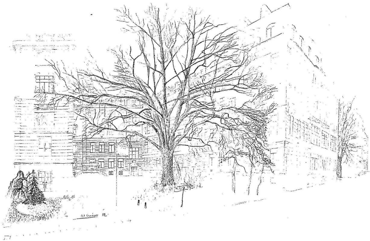
Abb. 1. Die II. Universitäts-Frauenklinik in Wien, Nordfront; Eingang in Ambulanz und Hörsaal

The Second Gynaecological Department of Vienna University